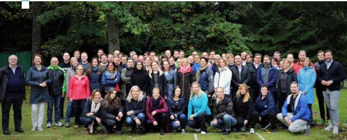
EØS-tilsynet ESAs medarbeidere

ESA deltar i EU-domstolen når de behandler saker som har særlig betydning for EØS-retten.